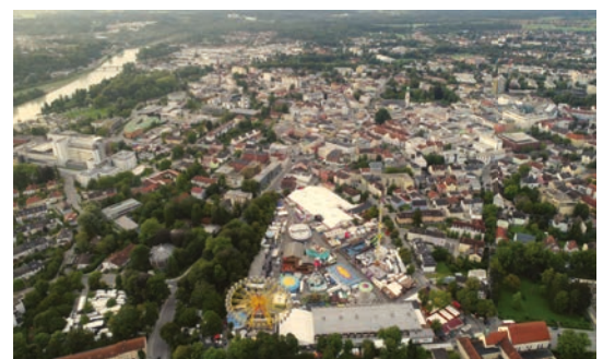
Herbstfest Impressionen – herzlichen Dank an die Fotografen Manfred Huber (li.) und Manfred Geishauser (re.) für diese tollen Aufnahmen